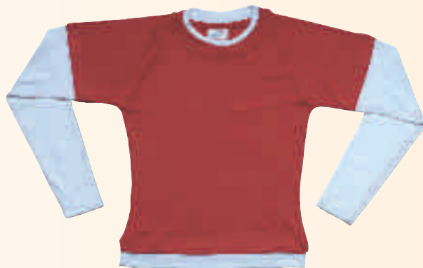
ROJO / BLANCO