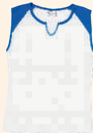
BLANCO / AZUL ROYAL