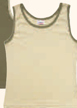
BEIGE / KAKI