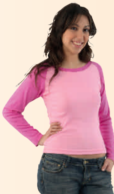
ROSA / FUCSIA