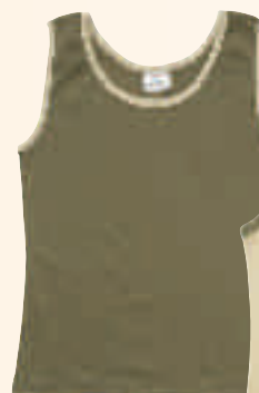
KAKI / BEIGE