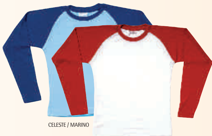
CELESTE / MARINO